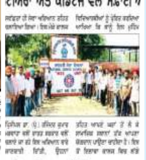
ਦੇਸ਼ ਪ੍ਰਦੇਸ਼ ਟਾਈਮਜ਼

ਗੁਰੂ ਨਾਨਕ ਦੇਵ ਯੂਨੀਵਰਸਿਟੀ ਕਾਲਜ ਪੱਟੀ ਵਿਖੇ ਅਧਿਆਪਕ ਦਿਵਸ ਮਨਾਇਆ