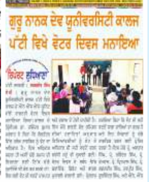
ਦੇਸ਼ ਪ੍ਰਦੇਸ਼ ਟਾਈਮਜ਼