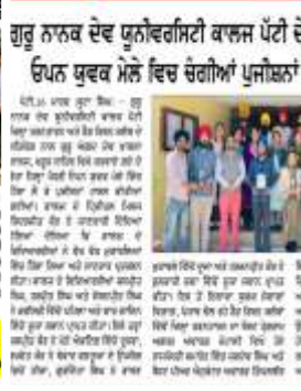
ਦੇਸ਼ ਪ੍ਰਦੇਸ਼ ਟਾਈਮਜ਼