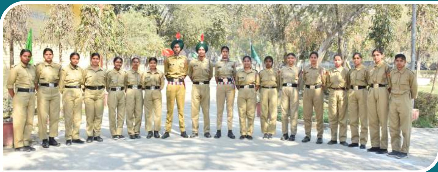
Guru Nanak Dev University College, Patti TARN TARAN (PUNJAB), INDIA.