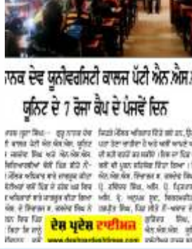
ਦੇਸ਼ ਪ੍ਰਦੇਸ਼ ਟਾਈਮਜ਼