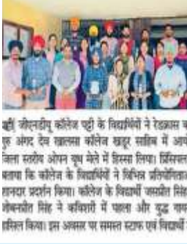
ਦੇਸ਼ ਪ੍ਰਦੇਸ਼ ਟਾਈਮਜ਼