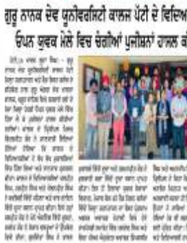
ਦੇਸ਼ ਪ੍ਰਦੇਸ਼ ਟਾਈਮਜ਼