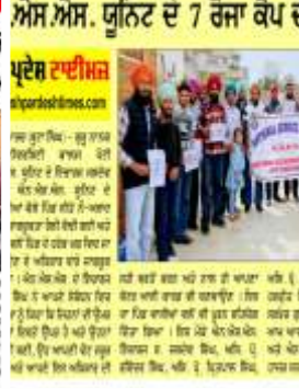
ਦੇਸ਼ ਪ੍ਰਦੇਸ਼ ਟਾਈਮਜ਼