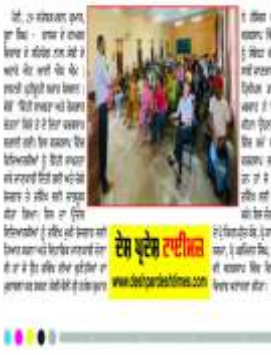
ਦੇਸ਼ ਪ੍ਰਦੇਸ਼ ਟਾਈਮਜ਼