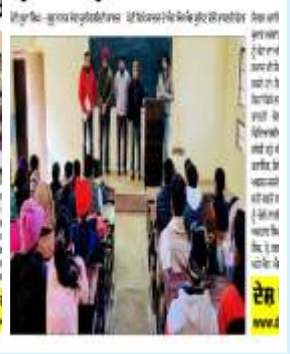
ਦੇਸ਼ ਪ੍ਰਦੇਸ਼ ਟਾਈਮਜ਼