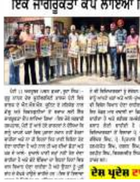
ਦੇਸ਼ ਪ੍ਰਦੇਸ਼ ਟਾਈਮਜ਼