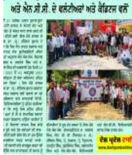
ਦੇਸ਼ ਪ੍ਰਦੇਸ਼ ਟਾਈਮਜ਼

ਗੁਰੂ ਨਾਨਕ ਦੇਵ ਯੂਨੀਵਰਸਿਟੀ ਕਾਲਜ ਪੱਟੀ ਵਲੋਂ ਐਨ.ਐਸ.ਐਸ. ਅਤੇ ਵੈਨਟੀਅਰਾਂ ਅਤੇ ਕੈਂਡਿਡੇਟ ਵਲੋਂ