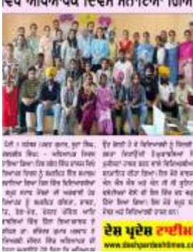
ਦੇਸ਼ ਪ੍ਰਦੇਸ਼ ਟਾਈਮਜ਼