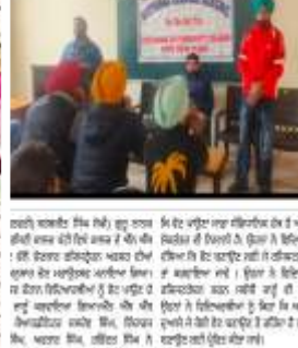
ਦੇਸ਼ ਪ੍ਰਦੇਸ਼ ਟਾਈਮਜ਼

ਗੁਰੂ ਨਾਨਕ ਦੇਵ ਯੂਨੀਵਰਸਿਟੀ ਕਾਲਜ ਪੱਟੀ ਵਿਖੇ ਅਧਿਆਪਕ ਦਿਵਸ ਮਨਾਇਆ