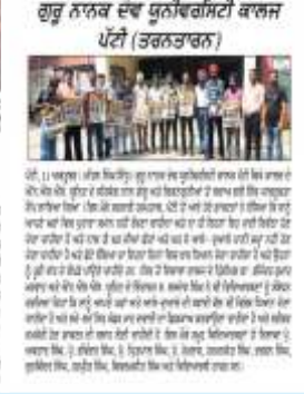
ਦੇਸ਼ ਪ੍ਰਦੇਸ਼ ਟਾਈਮਜ਼