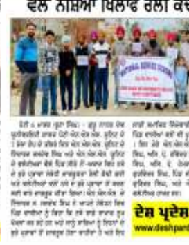
ਦੇਸ਼ ਪ੍ਰਦੇਸ਼ ਟਾਈਮਜ਼