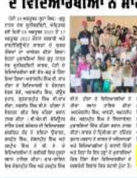
ਦੇਸ਼ ਪ੍ਰਦੇਸ਼ ਟਾਈਮਜ਼