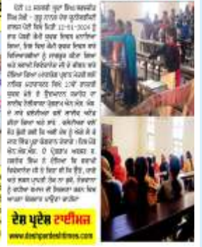
ਦੇਸ਼ ਪ੍ਰਦੇਸ਼ ਟਾਈਮਜ਼