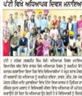
ਦੇਸ਼ ਪ੍ਰਦੇਸ਼ ਟਾਈਮਜ਼

ਗੁਰੂ ਨਾਨਕ ਦੇਵ ਯੂਨੀਵਰਸਿਟੀ ਕਾਲਜ ਪੱਟੀ ਵਿਖੇ ਅਧਿਆਪਕ ਦਿਵਸ ਮਨਾਇਆ