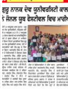
ਦੇਸ਼ ਪ੍ਰਦੇਸ਼ ਟਾਈਮਜ਼